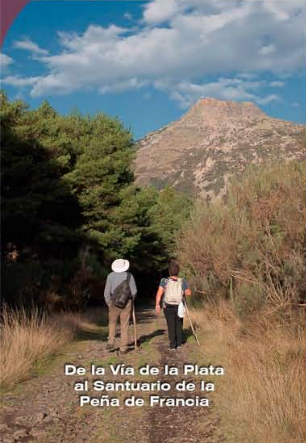
De la Vía de la Plata al Santuario de la Peña de Francia